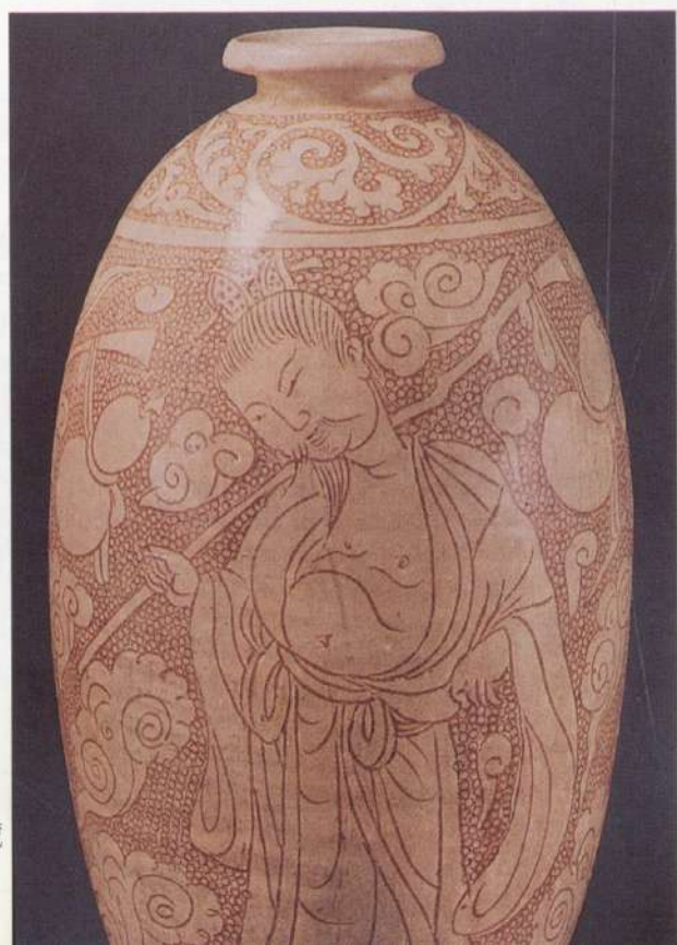
● 圖三：北宋磁州窯 珍珠地人物劃花 Museum of Fine Arts, Boston藏