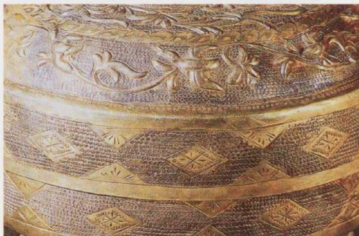
● 圖四：唐鎏金鸚鵡紋銀盒局部 江蘇丹徒丁卯橋出土