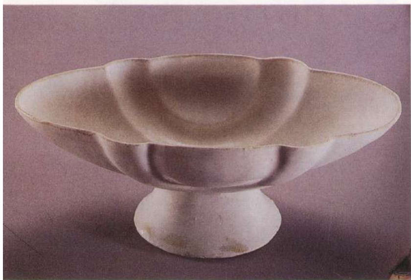
● 圖一：水邱氏墓出土白瓷官字款八曲杯。