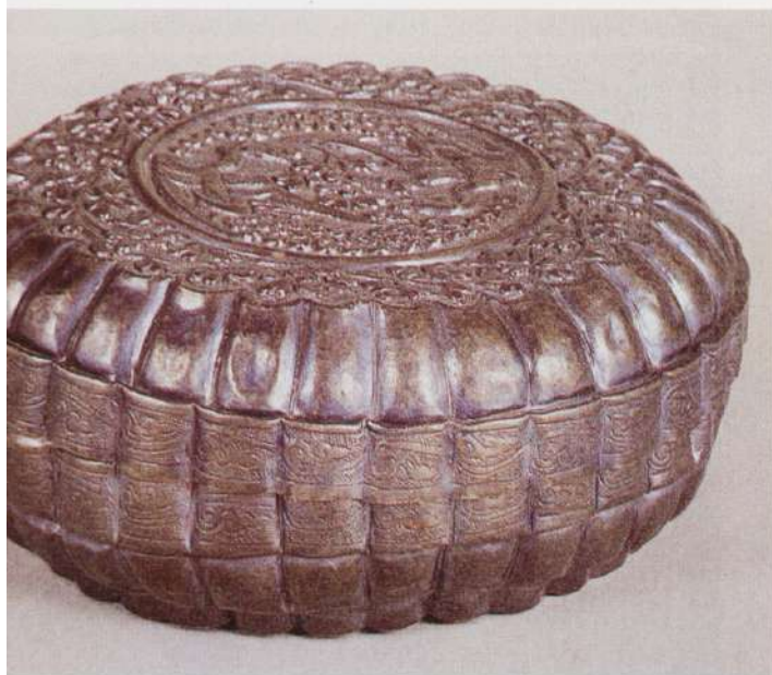
● 圖七：宋蓮瓣銀盒 四川德陽縣孝泉鎮出土

貴族水邱氏墓中的白瓷官字款八曲杯（圖一），便明顯的是取材自金銀器造型（圖二）。宋代磁州窯中流行的魚子紋（圖三），則為模仿金銀器的圈點壓印紋（圖四）。至於當時中國北方定窯、南方景德鎮皆大為流行的陶印花青白瓷或白瓷，或者是杭州灣南岸越窯的高浮雕、針刻花技法（圖五），同樣是來自於金銀器錘碾打造的靈感。當時中國南方各窯廠大