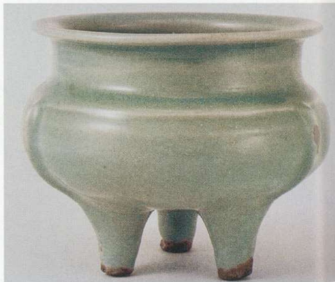
● 圖十：南宋一元龍泉窯青瓷鬲式爐南韓新安沈船出土