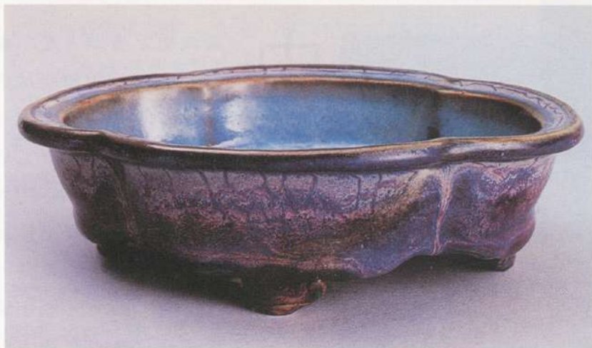
● 圖十四：鈞窯窯變海棠式盆托 上海博物館藏

更是富有文化氣息，他不但設置畫院，同時也注意到宮廷陶瓷的設計。在宮廷皇室的優雅審美品味的引導下，中國陶瓷脫離了仿造其他器物的附屬地位，展現出陶瓷藝術特有的表現形式，例如宋代汝窯、官窯等單色釉瓷器中特有的溶玉質感（圖十三）、鈞窯作品中的銅發色釉特殊窯變效果（圖十四）等，這些都是陶瓷獨有的創作技法，前代所不曾出現過的。這樣的陶瓷品味，上行下效，在民間也大為流行，甚至到了元朝也流行了相當長的時間。