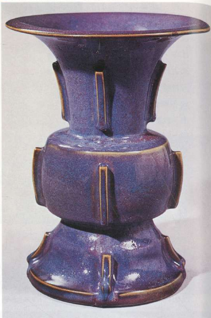
● 圖九：北宋鈞窯出戟尊 台北故宮博物院藏