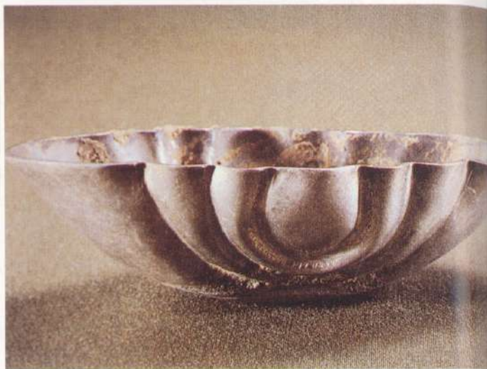
● 圖二：唐十二曲銀杯 陝西耀縣背陰村出土

西 元960年，趙匡胤結束了五代時期地方政權割據的局面，建立了統一的王朝，從經濟層面來看，十世紀的晚期以後，中國社會安定，生產力逐漸提高，工商業繁榮、人口密集的城市大為增加。從中國陶瓷發展史的角度來看，在燒造技術和生產數量上，皆大幅提升。在這一段長達三百年的歲月中，全國南北各地窯廠遍佈，不管是汝、官、定、鈞等生產貴族用器的名窯，或者是越窯、耀州窯、龍泉窯、磁州窯、景德鎮窯等民間窯廠，各自發展出極具特色的陶瓷作品。可以說是中國陶瓷最光輝燦爛的一頁。