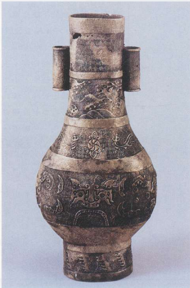
● 圖十二：南宋一元青銅陽刻饕餮紋貫耳瓶 南韓新安沈船出土