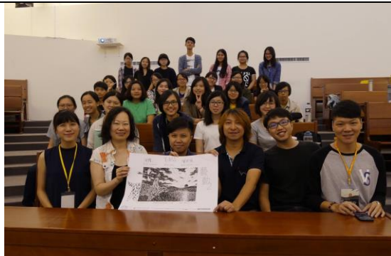
工作坊結束後大合照