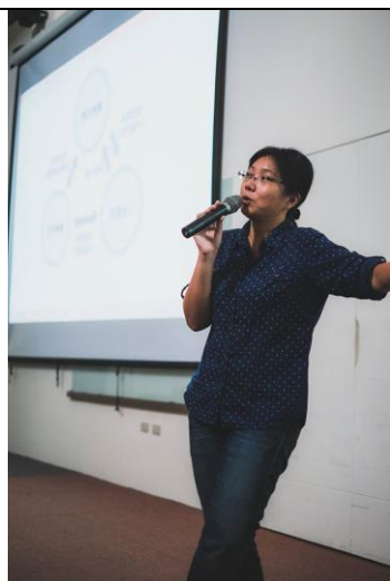
周于萱老師講座現場