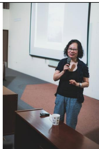
賀照緹導演講座現場