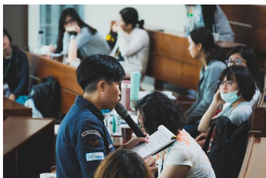
區秀詒老師講評學員作品