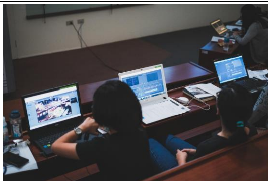
剪輯課程學員用各自的電腦學剪輯影片